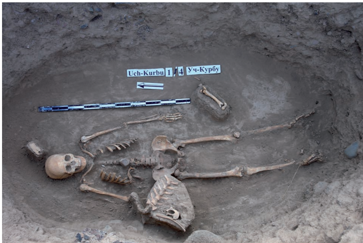
Рис. 3 . Уч-Курбу 1, курган 4. Погребение

1-й пол. I тыс. н.э. Племена, оставившие рассматриваемые своеобразные курганы, не жили изолированно, о чем свидетельствуют сходные элементы в погребальном обряде. Погребенные уложены на спину, в основном головой ориентированы в сторону севера (рис. 3). Для многих из них