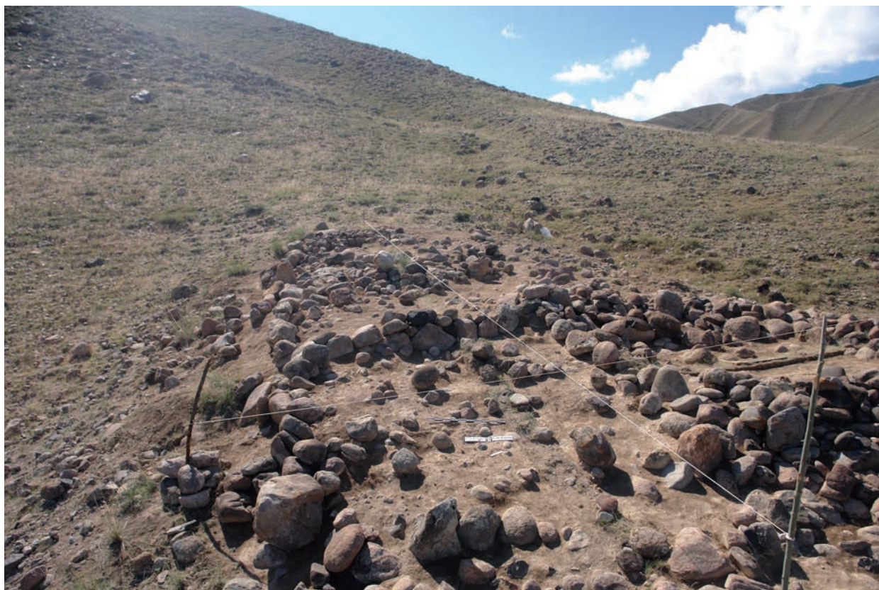
Рис. 2. Уч-Курбу 1, Иссык-Куль. Курганы с угловыми камнями

После проведения раскопок, определения хронологии (табл. 1) выясняется, что указанные группы населения, которые оставили «курганы с угловыми» камнями, сосуществовали с населением