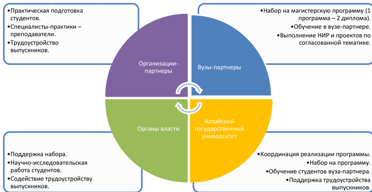
Рис. 3. Участие партнеров образовательного консорциума в реализации образовательной программы

– организация производственной практики (научно-исследовательская работа) – Институт экономики и организации промышленного производства СО РАН.