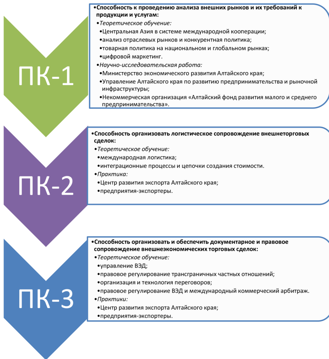
Рис. 1. Профессиональные компетенции образовательной программы и их формирование

рынку труда, требующему подготовки высококвалифицированных специалистов в сфере внешнеэкономической деятельности, способных выполнять разнообразные типы задач с применением современного инструментария для их решения.