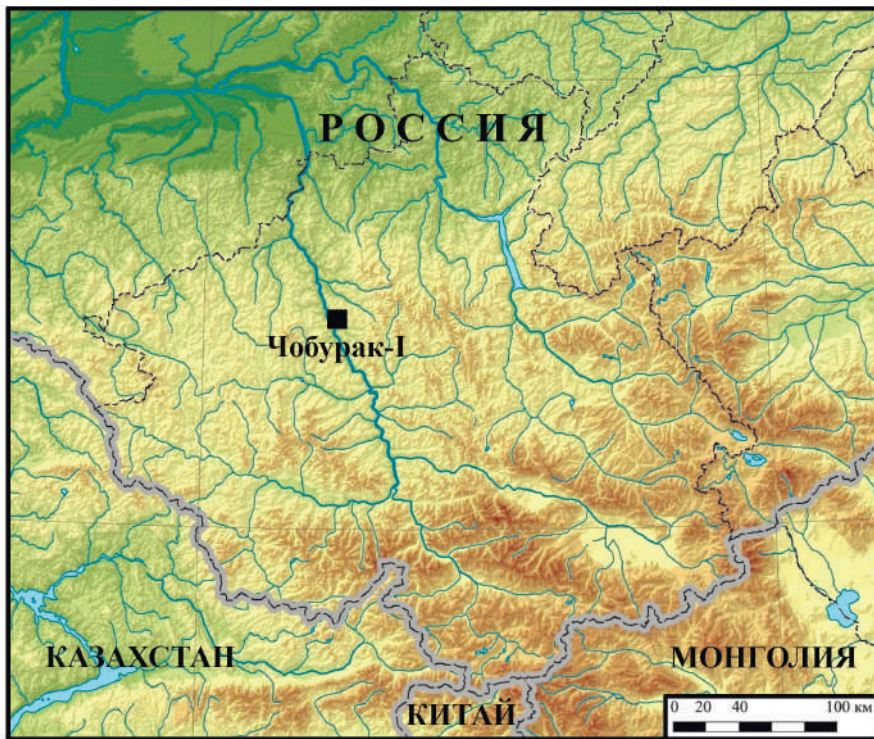
Рис. 1. Расположение погребально-поминального комплекса Чобурак-I Fig. 1. Location of the funeral and memorial complex Choburak-I