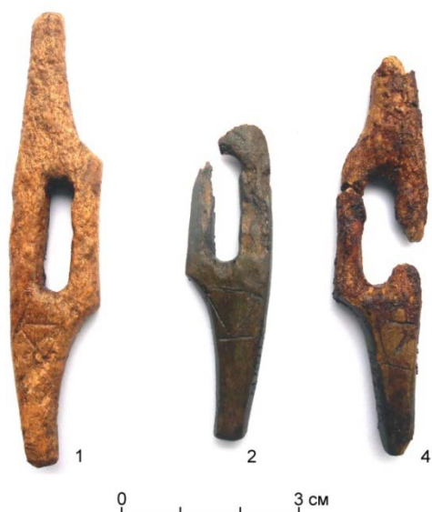
Рис. 1. Тамги рода Ашидэ на роговых подпружных пряжках из погребения кургана 1 могильника Чоба VII. Алтай

Мне удалось лично ознакомиться с застёжками для пут в фондах НМРА (г. Горно-Алтайск)*. Их инвентарные номера следующие: 10478/7, 10478/9, 10478/10. Средние размеры застёжек составляют 8×1,5 см, две из них обломаны. На трёх застёжках, сбоку от центрального отверстия, на наиболее широкой плоскости вырезана одна и та же тамга – треугольник, у одного из углов которого прочерчена линия, параллельная основанию треугольника (рис. 1).