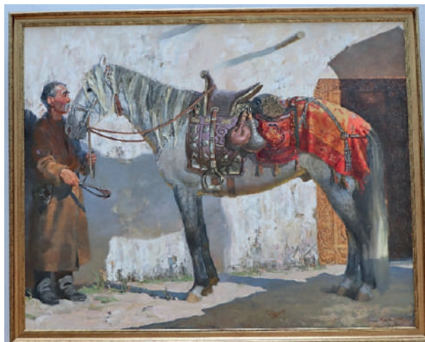
Рис. 6. Меиржан Нұрғожин «Әбзел / Сбруя»

Одним из мотивов, тесно связанных с культурой Казахстана, являются образы животных, особенно лошадей. В культуре кочевников лошадь играла огромную роль — она была необходима для перевозки грузов, охоты и сражений. На многих картинах казахских художников можно увидеть изображения лошадей, часто в сочетании с кочевниками. Например, на картине яркого художника Меиржана Нұрғожина «Әбзел / Сбруя» (рис. 6), которая поражает своей гармонией и эстетической привлекательностью. В ней смело сочетаются элементы традиционной казахской культуры и современной живописи, создавая уникальный образ, который привлекает внимание зрителей.