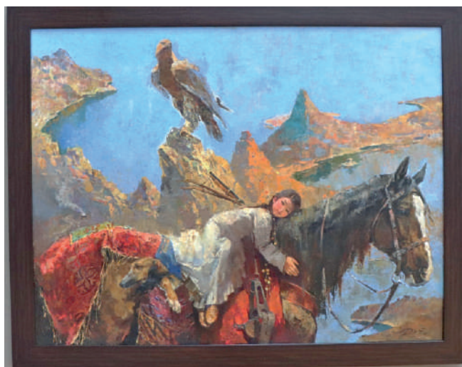
Рис. 9. Досбол Касымов «Жеті қазына / Семь сокровищ»

Другой пример использования литературного мотива в живописи «картина Досбола Касымова «Жеті қазына / Семь сокровищ» (рис. 9), где художник изображает различные образы, символизирующие семь ключевых аспектов жизни. Эта работа помогает передать идею, что каждый аспект жизни имеет свой собственный ценный атрибут.