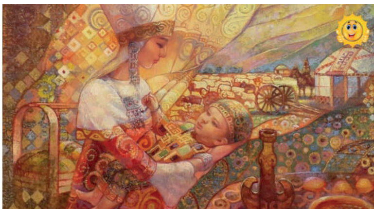
Рис. 5. Степная мадонна

Художество всегда служило средством для выражения культурных ценностей и идентичности. Елена Тё, художница из Алматы, представляет собой выдающийся пример художника, чье творчество охватывает широкий спектр тем, включая национальные эпосы, городские пейзажи, цветы и природу. Уникальный колорит и обращение к национальным темам делают ее творчество важным объектом исследования. Одной из наиболее узнаваемых черт в творчестве Елены Тё является ее колористическая манера. Произведения художницы часто характеризуются золотисто-охристым оттенком и размытыми переходами между цветами. Этот стиль придает ее работам уникальную атмосферу и глубину. Такой колорит обеспечивает произведениям особый художественный шарм и отличает их от других произведений современного искусства.