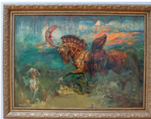
Рис. 7. Ұлан Дайбай «Алтын ат / Золотой конь»

Также следует отметить, что картина Меиржана Нургожина вызывает эмоциональный отклик у зрителей, позволяя им пережить те чувства и эмоции, которые художник вложил в свою работу. В целом, работа «Әбзел / Сбруя» (рис. 6) является ярким примером современного национального изобразительного искусства.