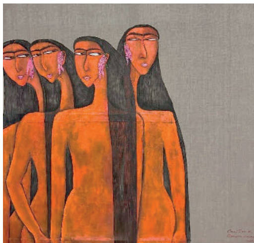
Рис. 2. «Qamchégül Qizlar»

Символика цветов, присутствующая в этой работе, олицетворяет процветание и счастье в восточной культуре. Воспринимая цветы как нечто большее, чем просто декоративный элемент, Гузель поднимает важный вопрос о красоте как проявлении души.