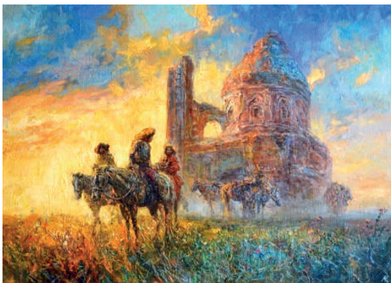
Рис. 3. «Жүк несене» из серии «Быт казахов»

Однако его вклад в художественное наследие Казахстана не ограничивается только классическим реализмом. Евгений Ким активно изучает исторические документы, фольклор и обычаи кочевников, что вдохновляет его на создание уникальной художественной серии под названием «Быт казахов 19-го — начала 20-го века» [5] (рис. 3).