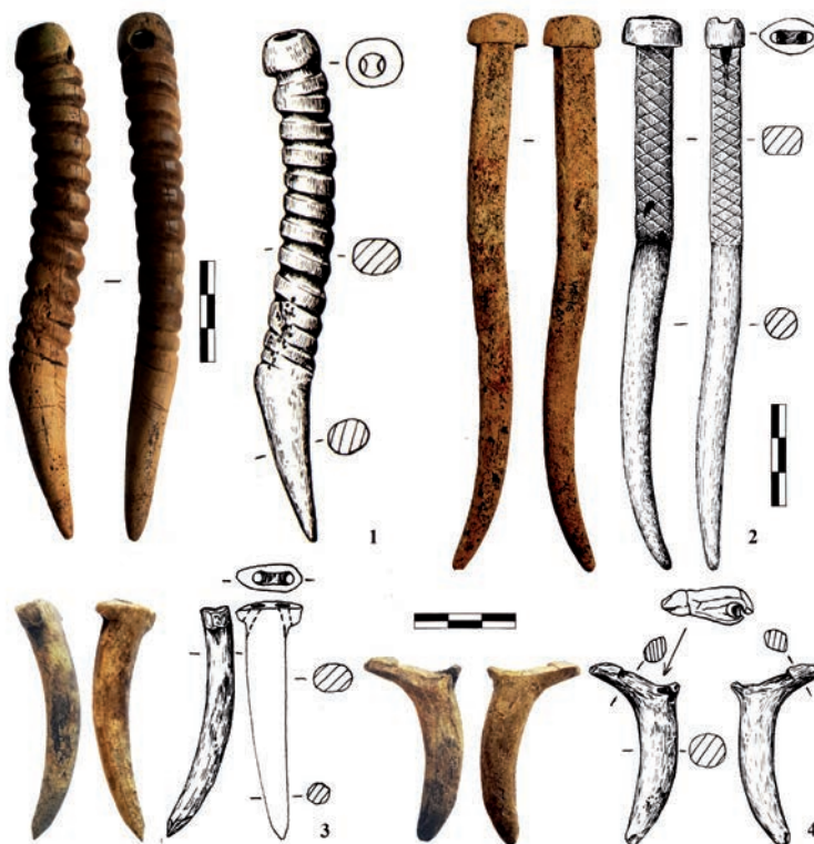
Рис. 2. Кочедыки из могильника Чумыш-Перекаат: 1 – могила № 28; 2 – могила № 20; 3–4 – могила № 18

Предмет изготовлен, вероятнее всего, из отростка рога марала. Общая длина изделия 143 мм. Кочедык имеет «рабочую часть» и рукоять с «навершием» (рис. 2, 2). «Рабочая часть» сохраняет естественную форму отростка рога с изгибом, в сечении круглая, имеет длину 85 мм. Возможно,