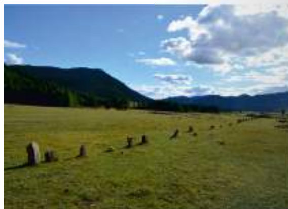
Тюркские оградки на могильнике Яломан