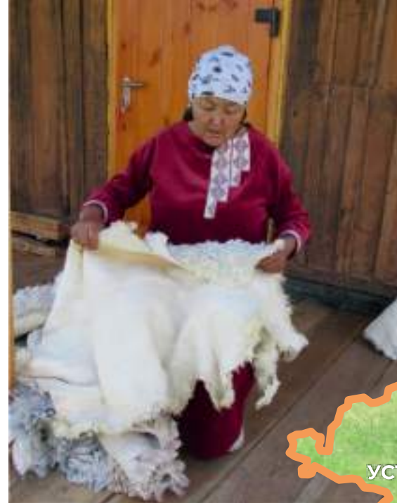
Мастерица за обработкой овечьей шкуры

Участники — 15 исследователей из России и Кыргызстана (АлтГУ, Горно-Алтайский государственный университет, Институт истории, археологии и этнологии им. Б. Джамгерчинова НАН Кыргызской Республики).