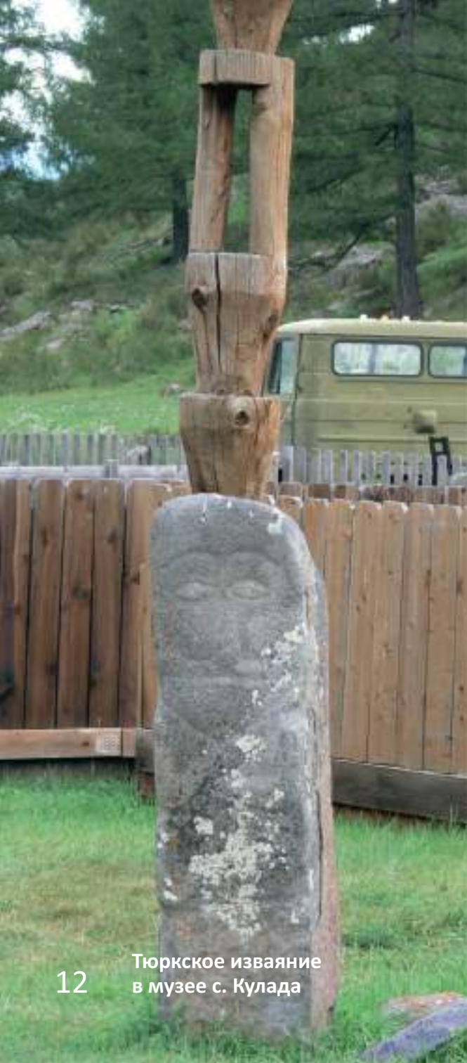
Тюркское изваяние в музее с. Кулада