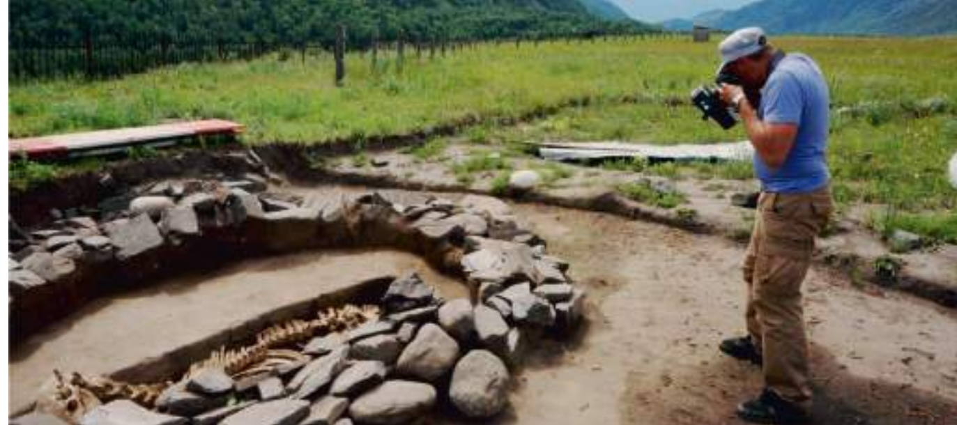
Фотосъемка погребения на могильнике Берель

Один из этапов экспедиции проходил в районе горы Калмаккырган в Казахстане, где была проведена фотосъемка для создания 3D-модели уже раскопанной поминальной оградки VII-VIII вв. н. э. Большую ценность представляет крупная стела — достаточно редкое и необычное сооружение для тех времен. Это свидетельство того, что оградка была сооружена на значимом для древних тюрков месте, возможно, на месте культового объекта более раннего времени. Кроме этого, была исследована новая, еще не изученная парная оградка.