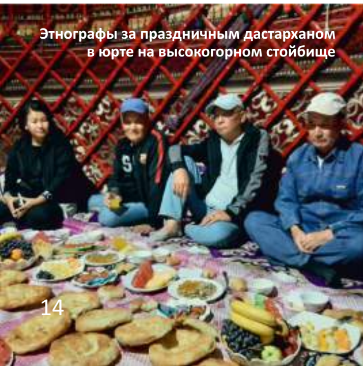
Этнографы за праздничным дастарханом в юрте на высокогорном стойбище