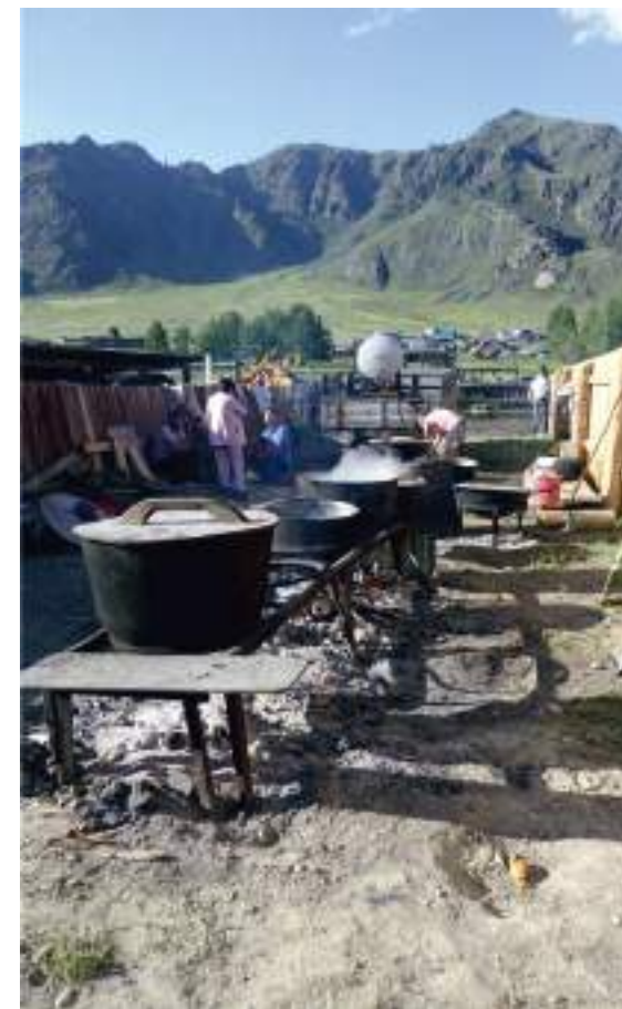
Котлы для приготовления свадебного угощения

Во многих населенных пунктах, где работала экспедиция, алтайцы по-прежнему занимаются скотоводством. В этих селах приобрела большую популярность национальная конноспортивная игра Кök бөрү , идею проведения которой алтайцы в 2003 году позаимствовали в Кыргызстане.