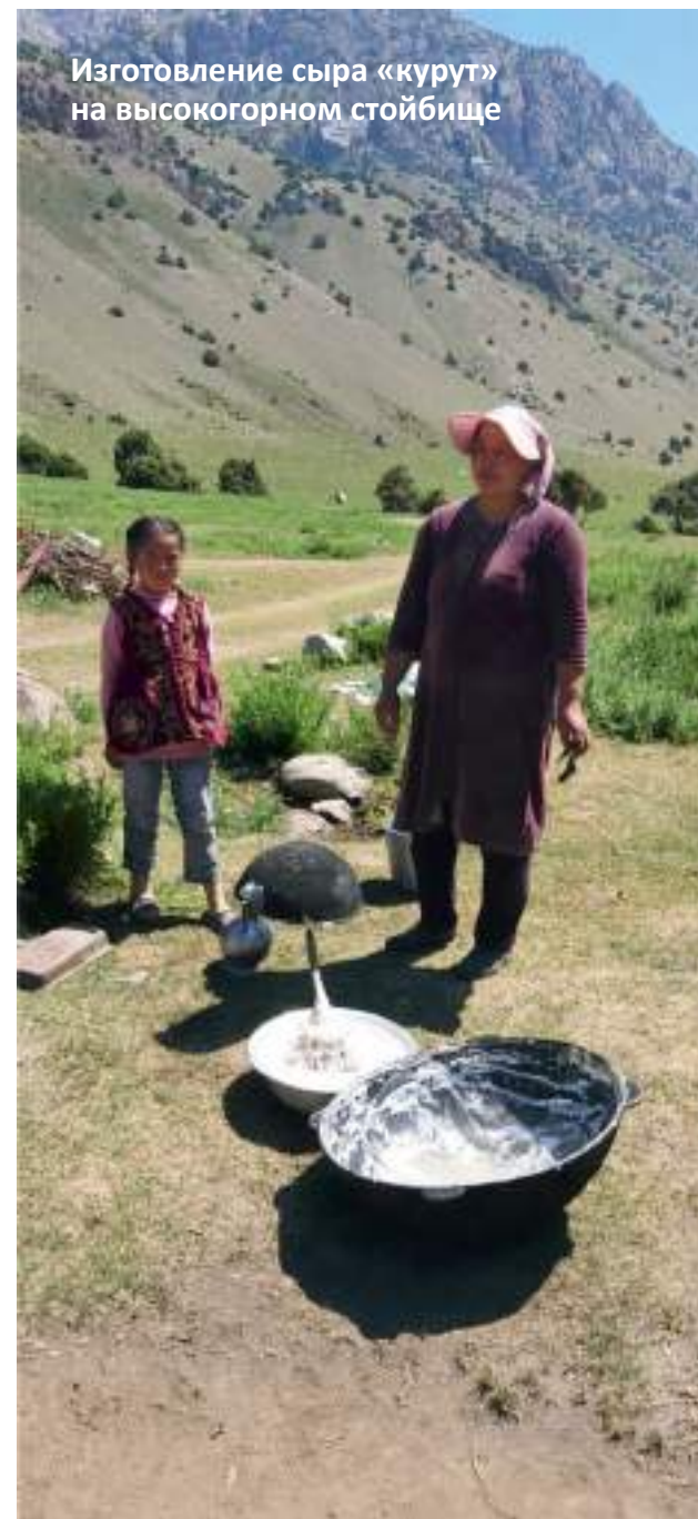
Изготовление сыра «курут» на высокогорном стойбище

Членам экспедиции удалось дополнить фрагментарные сведения о кыргызской родовой группе чогорок . Эта группа, кочевавшая в пределах Памиро-Алтая и известная еще по письменным источникам XVI века, осела в Чон-Алайском районе и вошла в состав племенного объединения теит . Сегодня представители группы чогорок проживают компактно в нескольких населенных пунктах и сохраняют устойчивую многоуровневую родоплеменную идентичность.