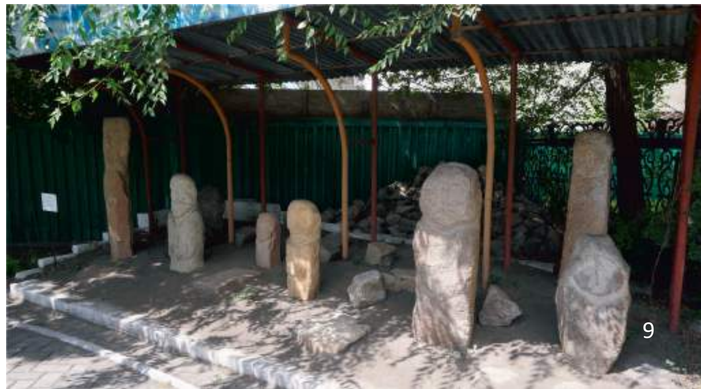
Тюркские изваяния в Областном историко-краеведческом музее г. Семей