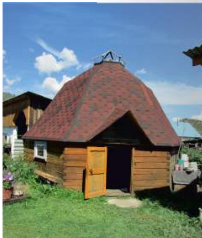
Современный аил в с. Бичикту-Боом

Отмечена высокая активность алтайцев по сохранению и возрождению традиционной культуры. Мастера-ремесленники воссоздают необходимые для жизнедеятельности предметы (конскую упряжь, плетки, головные уборы, одежду, обувь, орудия труда и т.п.) и производят сувениры на продажу.