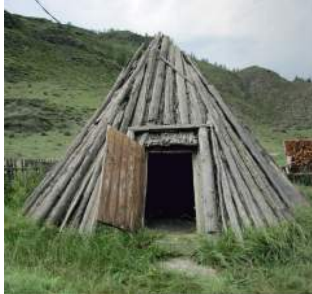
Старинный алтайский аил в с. Кулада

Отмечена сакральная роль традиционного жилища в современной семейной обрядности. Традиционные дома аилы — не просто хозяйственные объекты или элемент свадебного обряда, но и способ выражения этнической идентичности. В селах Каспа и Бичикту-Боом сохранившиеся образцы старинных конусовидных жилищ аланчык позволили описать их детали и архитектуру.