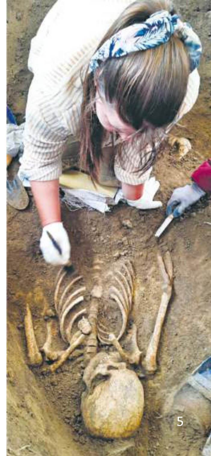
Зачистка погребения на могильнике Усть-Тёплая

Совместно с экспертом НОЦ алтаистики и тюркологии «Большой Алтай», доцентом АлтГУ Ольгой Латышевой проведена топографическая съемка объектов на памятнике Усть-Тёплая и урочище Бальчикова-3.