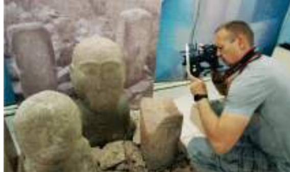
Фотосъемка в Областном историко-краеведческом музее г. Семей