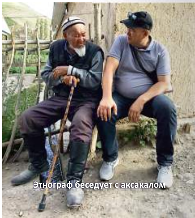
Этнограф беседует с аксакалом