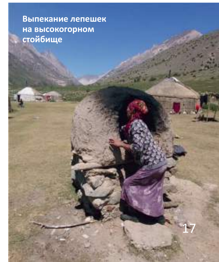
Выпекание лепешек на высокогорном стойбище

Членам экспедиции удалось дополнить фрагментарные сведения о кыргызской родовой группе чогорок . Эта группа, кочевавшая в пределах Памиро-Алтая и известная еще по письменным источникам XVI века, осела в Чон-Алайском районе и вошла в состав племенного объединения теит . Сегодня представители группы чогорок проживают компактно в нескольких населенных пунктах и сохраняют устойчивую многоуровневую родоплеменную идентичность.