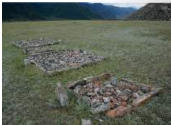
Тюркские оградки на могильнике Яломан