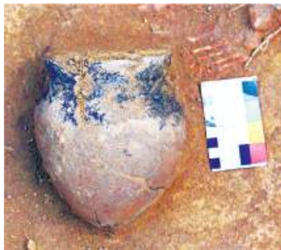
Керамический сосуд из погребения могильника Малая Татарка-2

Участники — 25 научных сотрудников, студентов, магистрантов и аспирантов АлтГУ, КемГУ, Института истории и материальной культуры РАН, Торайгырова университета Республики Казахстан.