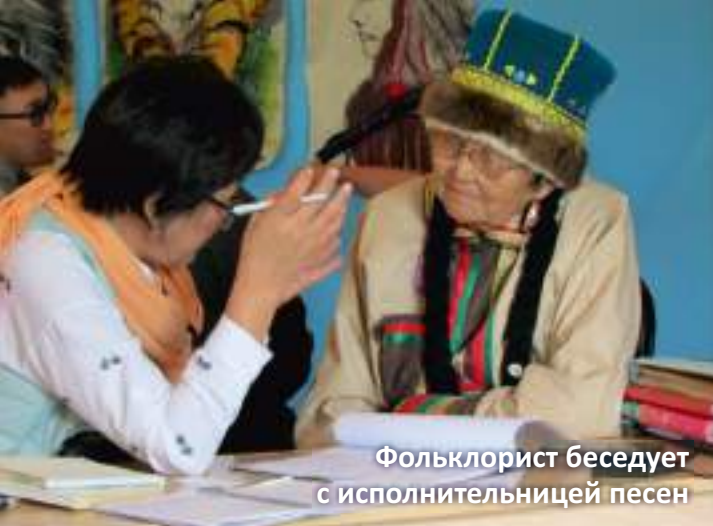
Фольклорист беседует с исполнительницей песен