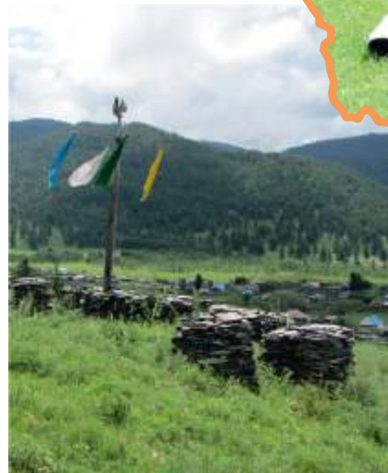
Тагыл – алтайское святилище в с. Шаргайта