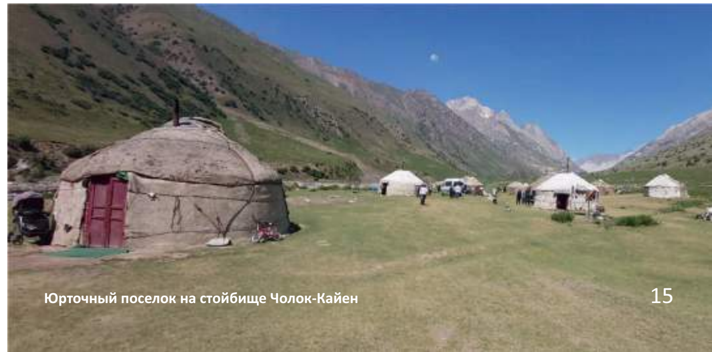
Юрточный поселок на стойбище Чолок-Кайен