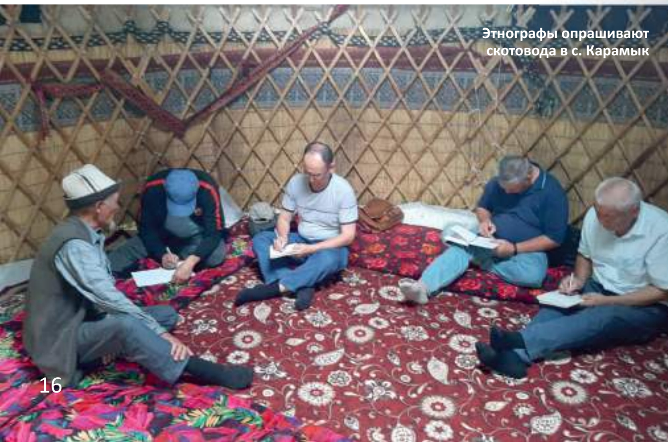
Этнографы опрашивают скотовода в с. Карамык

Установлено, что благодаря высокой роли скотоводческого хозяйства хорошо сохранились традиции изготовления и использования войлочной юрты ( боз уй ). Отмечена высокая сохранность традиционной системы питания, в которой значительное место занимают мясные блюда (баранина, конина), кисломолочные продукты ( айран, курут и т.п. ), различные лепешки домашнего приготовления ( латтыр-нан, казан-нан, каттама, чабатти и др. ).