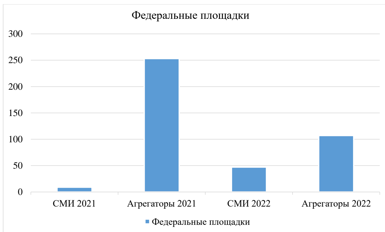
Диаграмма 1. Соотношение федеральных площадок

Большая часть материалов в первом полугодии 2021 года выходила на федеральных агрегаторах с посещаемостью не более 3000 уникальных посетителей в месяц. Несмотря на то, что количество публикаций на федеральных площадках в 2021 году выше (Диаграмма 1), рейтинг, качество и авторитетность медиаресурсов в 2022 году превышает показатель 2021 года (Диаграмма 2).