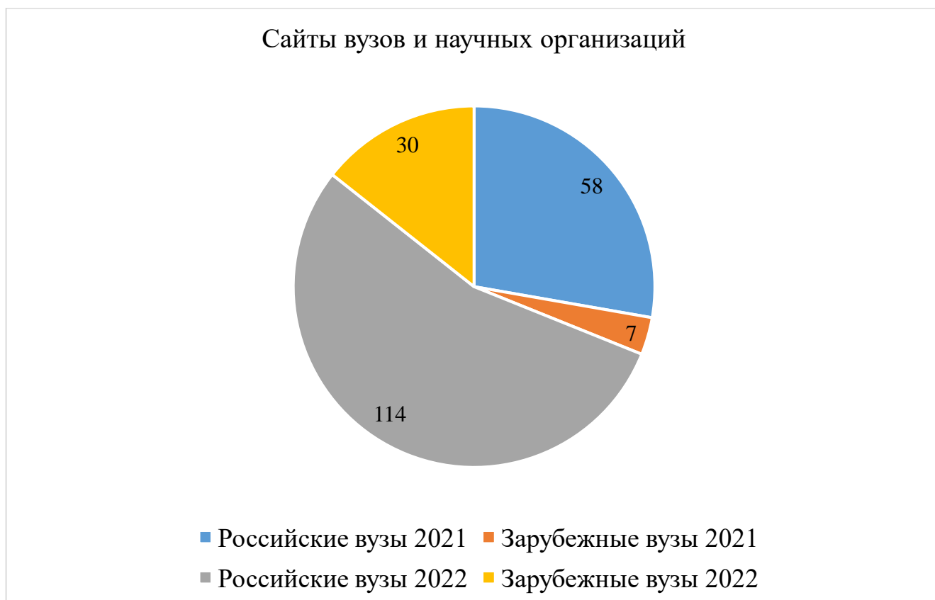
Диаграмма 4. Сравнительные показатели публикационной активности на сайтах российских, зарубежных вузов и научных организаций

По результатам сравнительного анализа медиаактивности проекта «Тюркский мир Большого Алтая: единство и многообразие в истории и современности» за первые 6 месяцев 2021-2022 гг. с января по июнь можно сделать вывод, что общее количество новостей за первое полугодие выросло в 1,5 раза, а проект в 2022 году зарекомендовал себя на зарубежном и российском медиапространстве, сформировал положительную репутацию и вызвал стабильный интерес со стороны научных, деловых и массовых медиаплощадок.