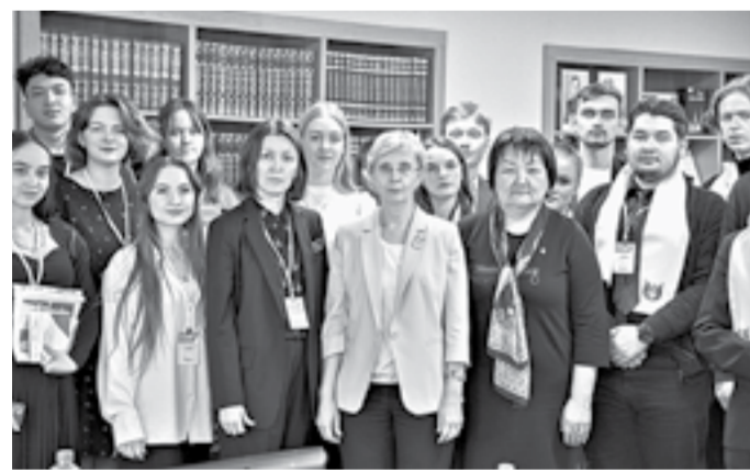
Участники международного круглого стола.