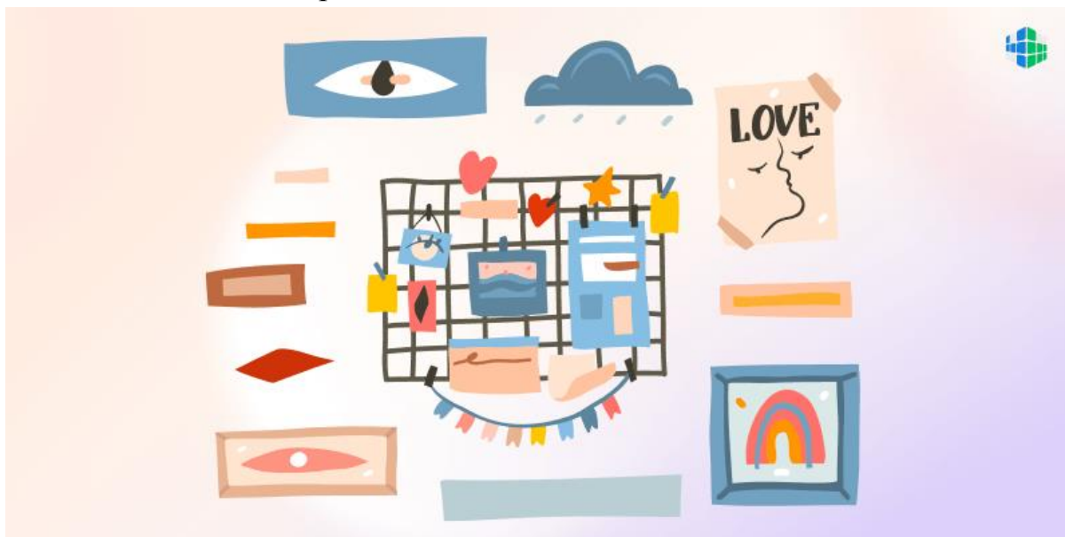
Рис. 1. Пример мудборда

Есть много мест, где вы можете создать доску настроения в интернете с помощью бесплатных сервисов.